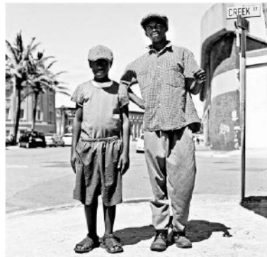
Sander Troelstra, Straatkinderen in Durban, Zuid-Afrika.

Grote publiekstrekker is de presentatie van het werk van drie kunstenaars in de Nederlands-Vlaamse portretfotografie: Kees Breukel, Joost