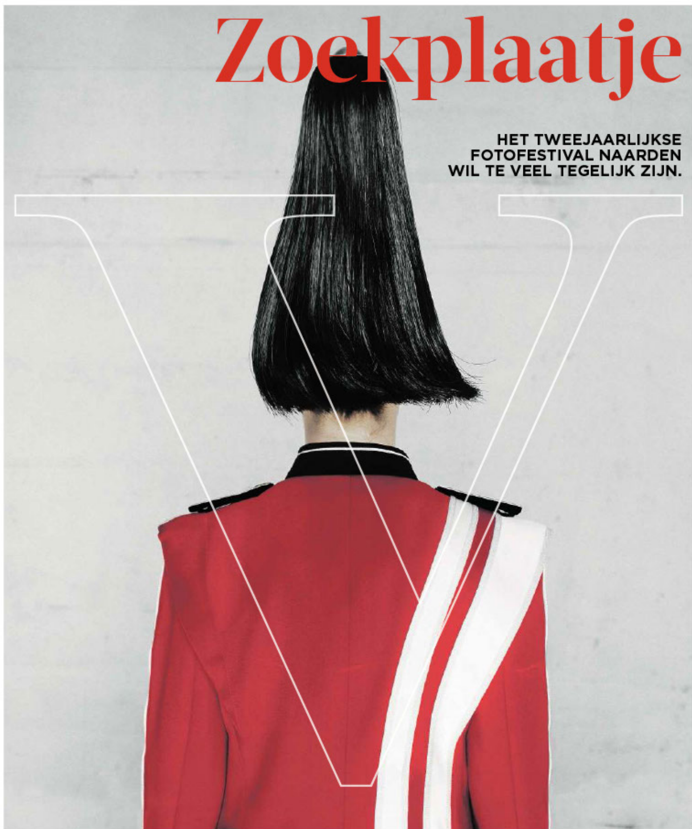
Uit de serie HaFaBra (een 'portret' van de Nederlandse harmonie-, fanfare- en brassbandwereld) van Niels Helmlnk.

HET TWEEJAARLIJKSE FOTOFESTIVAL NAARDEN WIL TE VEEL TEGELIJK ZIJN.